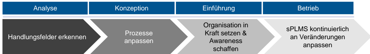
Abbildung 4: SPLMS Projekt-Vorgehensweise

Um ein SPLMS zu konzipieren, einzuführen und zu betreiben, hat sich in der Praxis die etablierte Projekt-Vorgehensweise als effizient erwiesen.