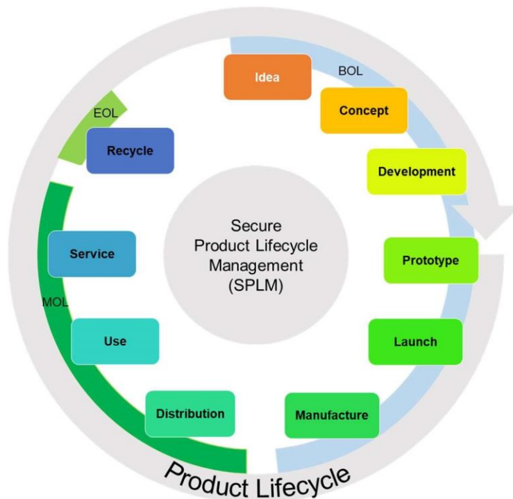
Abbildung 1: Sicheres-Produkt-Lebenszyklus-Management / Secure Product Lifecycle Management (SPLM)

Eine wichtige Komponente, um dieser Herausforderung nachhaltig gerecht zu werden, sind die "Security by Design"-Prinzipien. Elementare Grundlage der "Security by Design" Prinzipien ist die Integration der Sicherheitsanforderungen in allen Phasen des Produkt-Lebenszyklus-Management / Product Lifecycle Management (PLM). Man spricht dann von einem Sicheren-Produkt-Lebenszyklus-Management / Secure Product Lifecycle Management.