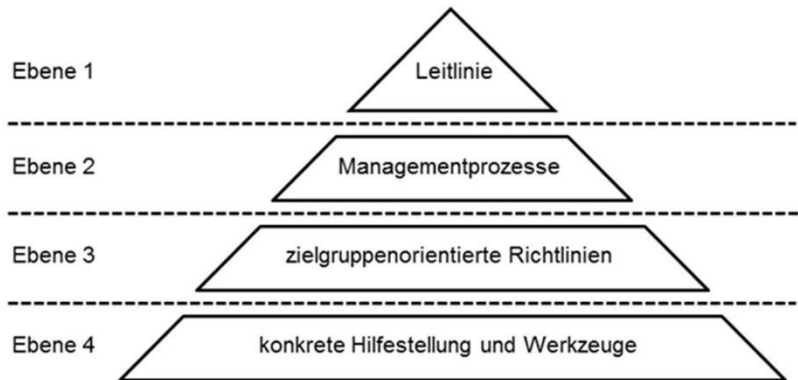
Abbildung 3: Struktureller Aufbau eines Sicheren-Produkt-Lebenszyklus-Management-Systems / Secure Product Lifecycle Management Systems (SPLMS)

Die Dokumentation des Sicheren-Produkt-Lebenszyklus-Management-Systems / Secure Product Lifecycle Management System (SPLMS) wird in Anlehnung an andere Managementsysteme in der Regel durch einen hierarchischen Aufbau charakterisiert und lässt sich in Form einer Pyramide veranschaulichen.